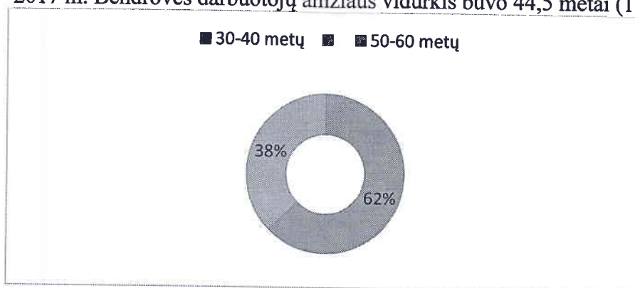
1 pav. Darbuotojų pasiskirstymas pagal amžiaus grupes, 2017 m.

2017 m. Bendrovės darbuotojų amžiaus vidurkis buvo 44,5 metai (1 paveikslas).